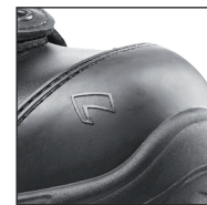
HAIX® Composite toe cap