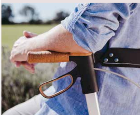
Armauflage aus Kork-TPE

Anti-Rutsch-Pads erleichtern das Ankippen des Rollators