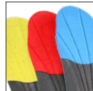
HAIX® Vario Wide Fit System