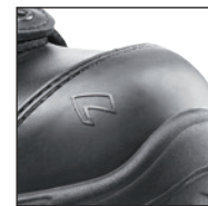
HAIX® Composite toe cap